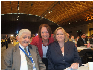
Dr. Burkhard Hirsch, Sabine Leutheusser-Schnarrenberger, Gisela Piltz