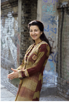
Dr. Necla Kelek