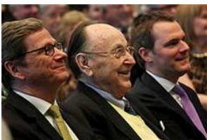
Dr. Guido Westerwelle, Hans-Dietrich Genscher, Daniel Bahr