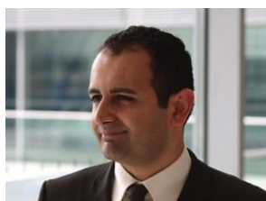
Bijan Djir-Sarai MdB

Am 03. März 2012 fand der ordentliche Kreisparteitag in der Handwerkskammer in Düsseldorf statt. Gastredner: Bijan Djir-Sarai MdB, Vorsitzender der Arbeitsgruppe Afghanistan der FDP-Bundestagsfraktion. Die einzelnen Tagungsordnungspunkte waren: