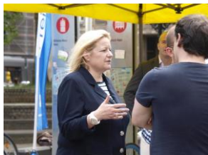
Gisela Piltz MdB bei der Deutschland-Sommertour 2012 der FDP Bundestagsfraktion in Düsseldorf