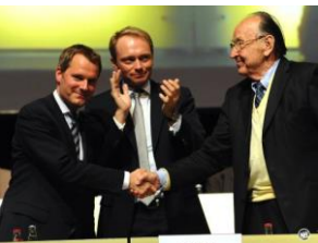
Daniel Bahr MdB, Christian Lindner MdB, Hans-Dietrich Genscher