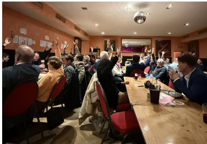
Konzentriertes Arbeiten beim Club Liberal XL zum Grundsatzprogramm der FDP

Auch ansonsten wurde intensiv inhaltlich gearbeitet. Der vom Kreisverband beschlossene Antrag zur Migrationspolitik wurde auf den höheren Ebenen eingereicht. Ein schöner Erfolg: beim Bezirksparteitag konnte der Antrag durchgebracht werden. Leider fehlte bislang auf der Landesebene die Zeit dafür, das Papier auch dort zu beraten. Aus dem Kreisvorstand heraus wurde jedoch auch Kontakt mit der Landtagsfraktion aufgenommen und der Dialog mit dem entsprechenden Fachpolitiker geführt.