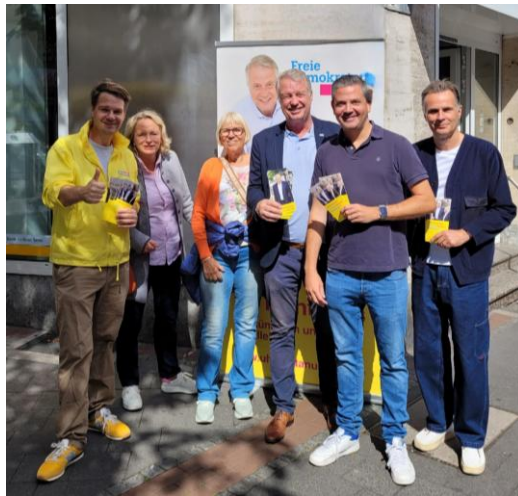
Das Spitzen-Trio der FDP zur Kommunalwahl mit Wahlkämpfern

dorf auf die Eins“ zu bringen, wie der Claim die Kampagne zusammenfasste, in deren Mittelpunkt die wirtschaftliche Entwicklung der Stadt, die Rückkehr zu soliden Finanzen, eine bessere Verkehrspolitik und mehr Sicherheit und Sauberkeit standen.